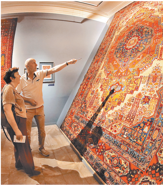
По этим коврам можно путешествовать, открывая детали нашей истории и ушедшего в прошлое быта.

Сильное впечатление производят ковры-портреты. У туркмен не было традиции изображения лиц. Она позаимствована из персидских миниатюр. Но как выразительны эти портреты! Ковры производства 30-х годов прошлого века запечатлели Ленина, Сталина, Калинин, а также Эрнста Тельмана и Анри Барбюса. У каждого ковра — порядковый номер: 7, 26, 30... Очевидно, что это — целый проект политической «ковровой пропаганды». Кстати, есть здесь и портрет Пушкина, и замечательный (уже азербайджанской работы) ковер с портретом Фирдоуси, окруженный цитатами из его поэм. Замысловатая арабская вязь как нельзя лучше вписывается в сложные орнаменты. У туркмен есть поговорка: «Человек рождается в ковер и уходит из жизни, завернутым в ковер». Стало быть, вся философия жизни, вся вселенная, окружающая человека, находит отражение в этих письменах, редуцированных в элементы узоров.