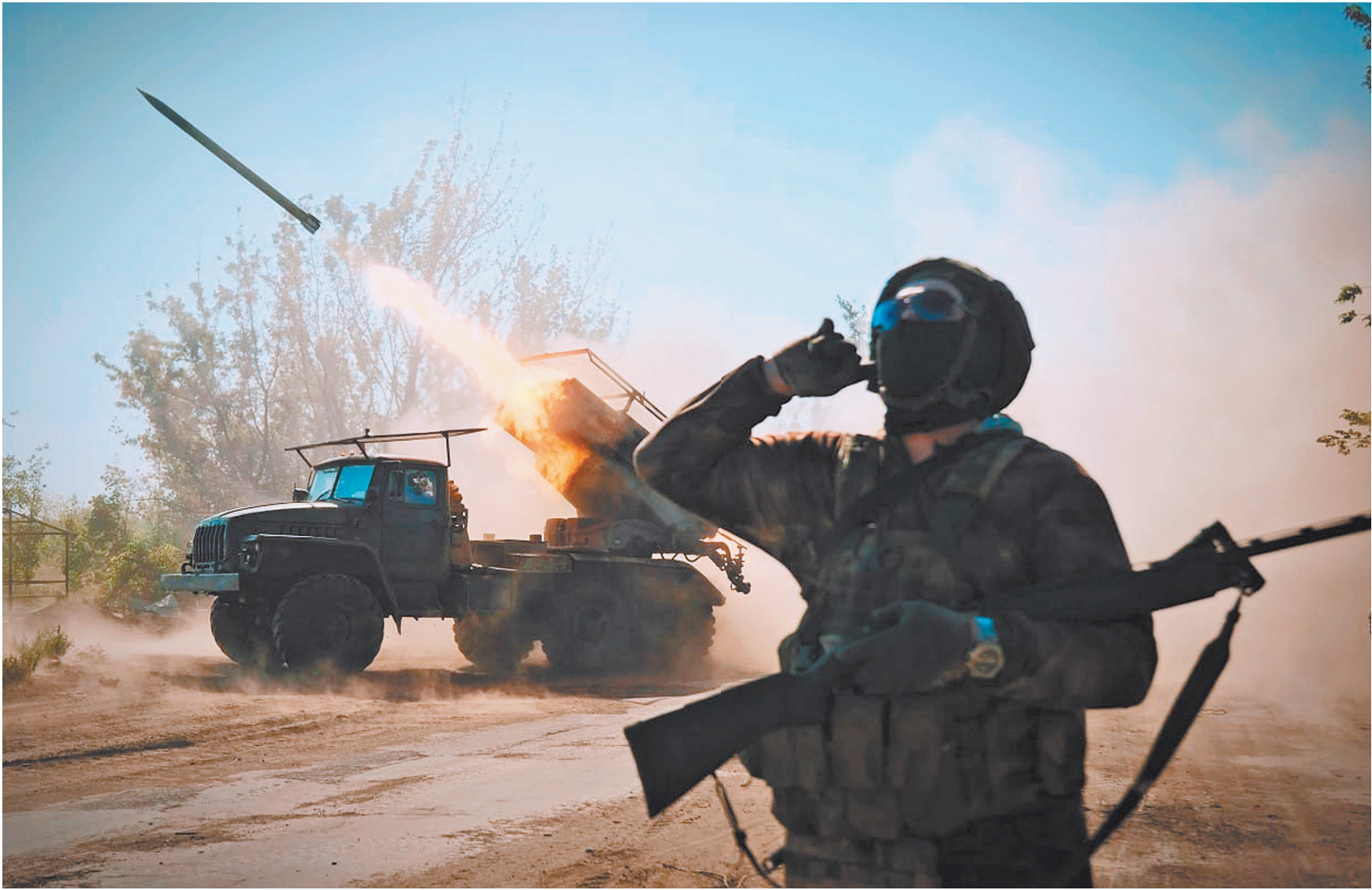
Расчеты РСЗО «Град» на покровском направлении днем и ночью утюжат позиции противника, помогая взламывать оборону украинской армии.