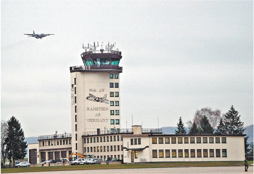
Встреча на военной базе Рамштайн показала, что Запад уже не собирается вкачивать в Украину миллиарды.