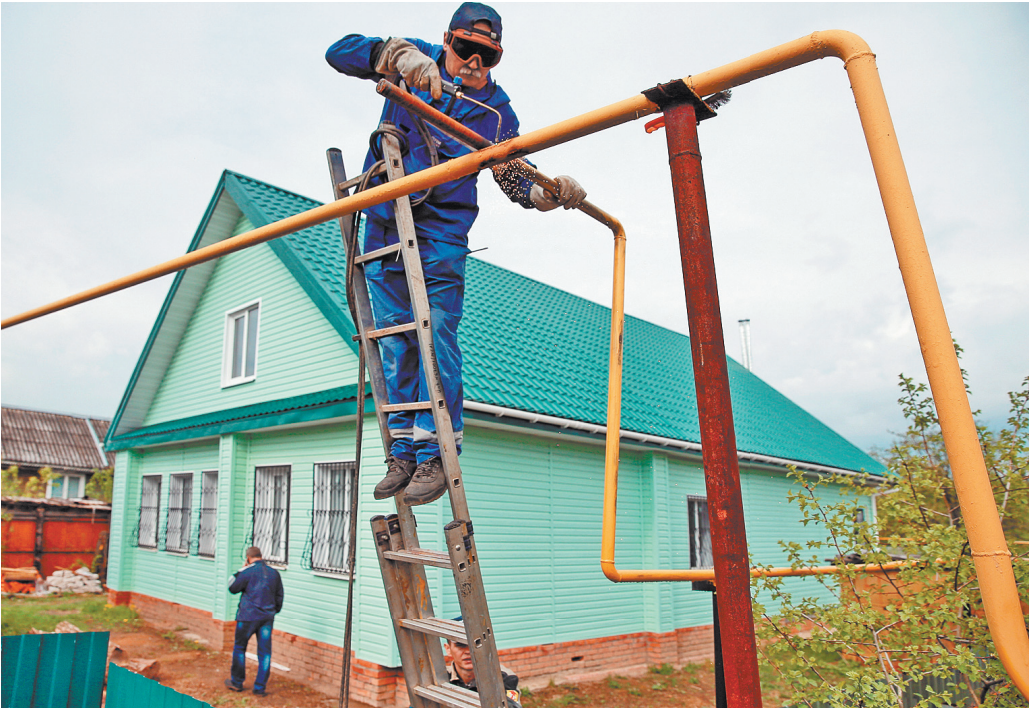
Провести газ в дачный дом — значит сделать его пригодным к круглогодичному проживанию.

Ни по срокам, ни по цене социальная газификация СНТ ничем не отличается от аналогичной газификации любых других населенных пунктов. До границ домовладения трубу проводят бесплатно, дальше стоимость работ будет зависеть от того, насколько далеко от забора располагается дом и какой комплект оборудования пожелает установить у себя собственник. Кого-то, например, устроит комплект-эконом, где в качестве системы безопасности установлены датчики, подающие при утечке газа звуковой сигнал. А кто-то захочет «Безопасный дом», в котором газовое оборудование соединяется с модемом. Если датчики фиксируют утечку, сигнал автоматически передается в аварийную газовую службу. И тогда не важно, дома хозяин или нет, аварийная бригада сможет оперативно перекрыть газ. Но в любом случае средняя стоимость подключения к газу по социальной программе не превысит 150–200 тысяч рублей. Это не миллион, который запрашивали с дачников до социализации, — если им вообще предлагали возможность подключиться к трубе. А чаще всего и не предлагали вообще. Газифицировать дачи считалось слишком нерентабельным удовольствием. ●