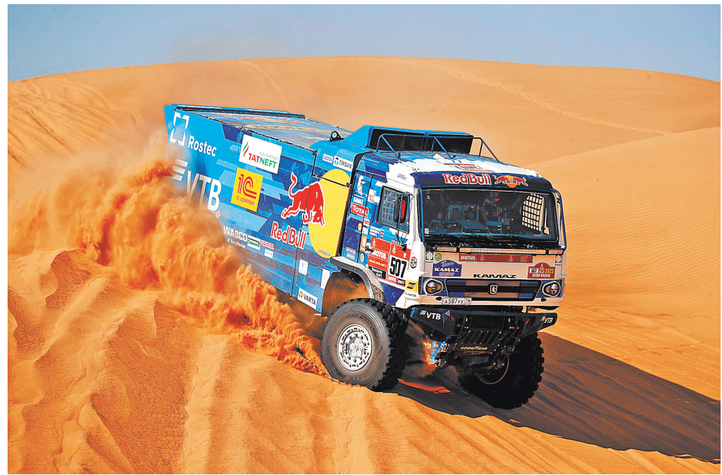
На завершившемся ралли «Дакар-2021» Дмитрий Сотников выиграл пять этапов из двенадцати.

ДИМИТРИЙ СОТНИКОВ: Все зависит от конкретных условий. Скажем, на одном из этапов расход был порядка 170 литров, а в среднем от 110 до 140. У нас установлено три бака, общим объемом 900 литров. Задний — примерно на 200 литров, еще два бака симметрично по краям — они примерно по 350. Такое расположение выбрано для улучшения центра масс — оно получилось ниже, а также для более правильного баланса по ходу гонки — идет более равномерное распределение во время движения.