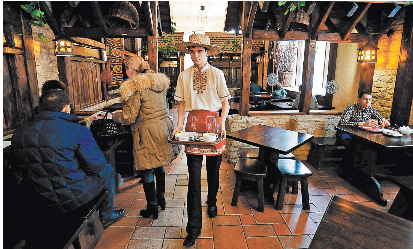
Теперь за официантами и работниками сферы услуг на Украине будут присматривать «мовные инспекторы».

ных ресурсах план-схему донослительства на русскоязычных граждан Украины. В распоряжении этого «шпрехен-фюрера» есть 60 «шпрехен-полищев», которые теоретически должны выявлять и оформлять случаи использования русского языка в бытовом обиходе как административные нарушения.