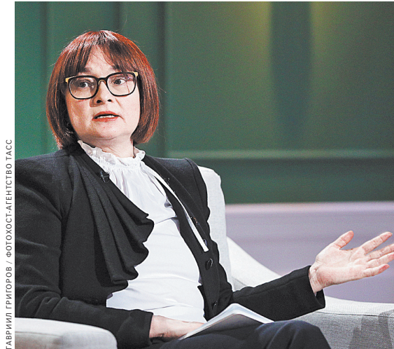
Эльвира Набиуллина считает авантюрой отрицательные процентные ставки, которые есть во многих развитых странах.

Сейчас в стране строится 154 млн кв. м многоквартирных домов, рассказал министр строительства и ЖКХ Ирек Файзуллин. И хотя в России более тысячи городов, 75% жилья, по данным ДОМ.РФ, строится в 20 крупнейших агломерациях, 64% — в 10 крупнейших. Это, по мнению заместителя гендиректора ДОМ.РФ Дениса Филипова, показывает, насколько важно заниматься развитием агломераций. ●