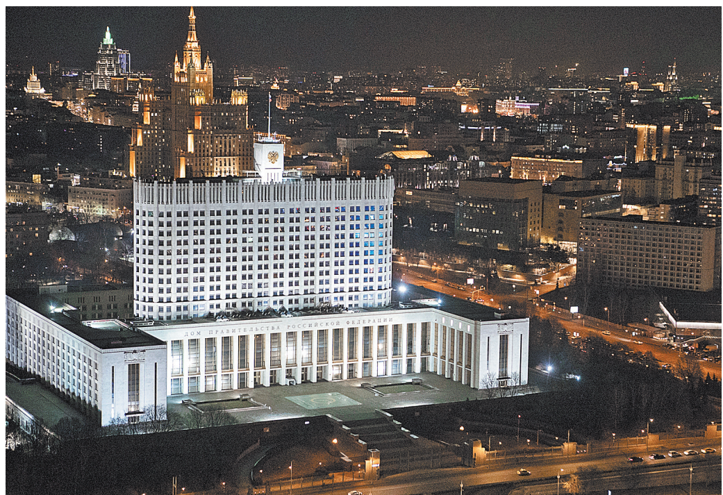
Изменения в структуру аппарата кабинета внесены в рамках реформы системы госуправления.

После вступления законов в силу у военных и чиновников, имеющих второе гражданство, будет 10 дней, чтобы в этом признаться. Они смогут остаться на службе, если подтвердят, что намерены выйти из чуждого гражданства: у них будет полгода, чтобы это сделать.