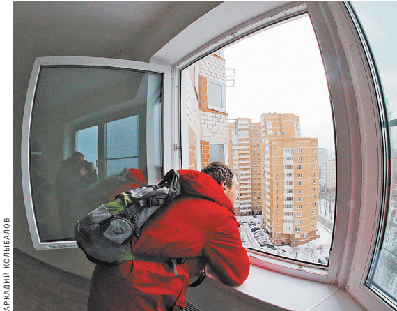
По программе реновации в Южном Медведково уже построили три новых дома.

Напомним, программа реновации в столице была принята в 2017 году. В соответствии с ней новое жилье вместо ветхого, идущего под снос, должны получить миллионы москвичей. Для этого в течение пятнадцати лет город обязался построить 16 миллионов квадратных метров новых квартир. В настоящее время идет либо закончено переселение 33,7 тысячи жителей.