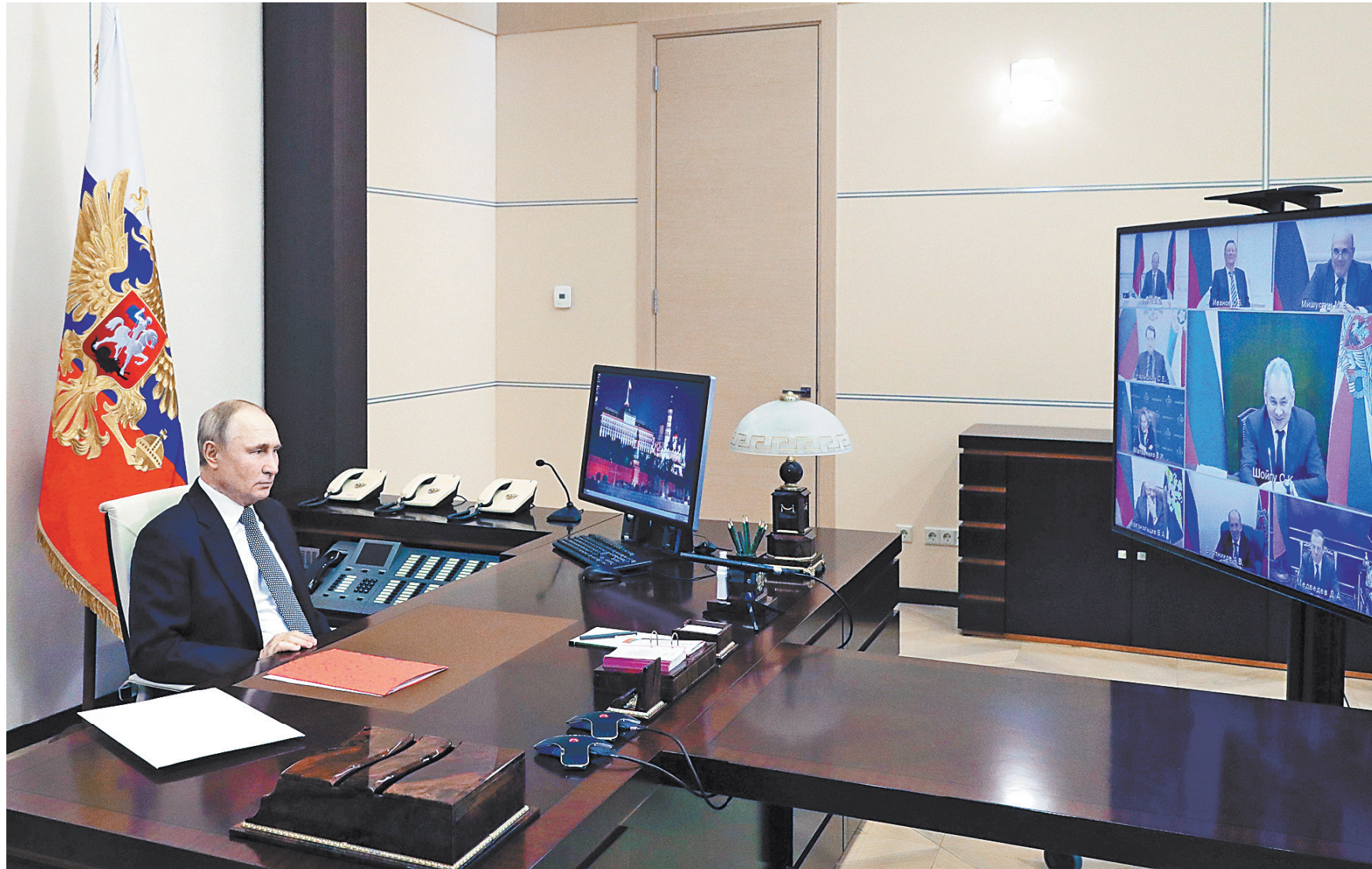
Президент провел совещание с постоянными членами Совбеза РФ в формате видеоконференции. Владимир Путин рассказал об итогах переговоров с президентом Азербайджана Ильхамом Алиевым и премьер-министром Армении Николом Пашиняном по вопросам нагорно-карабахского урегулирования. Также обсуждались актуальные вопросы внутренней и внешней политики.

Снижение энергоёмкости российской экономики было вызвано повышением энергоэффективности прежде всего в энергоемких секторах. Так, увеличение эффективности использования топлива генерирующим оборудованием электростанций при производстве электрической энергии обеспечило уменьшение потребления топливно-энергетических ресурсов до 80% от общего объема экономики по электроэнергетическому сектору в целом (совокупное снижение составило 1,41 млн т.у.т.).