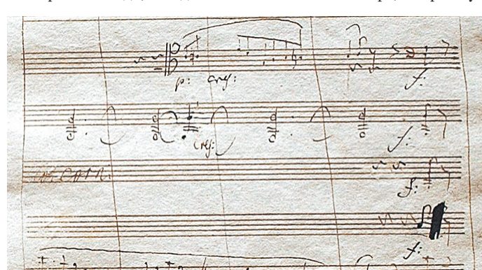
Авторитетные историки возражают борцам против расизма: симфонии Бетховена — «густки музыкальной энергии против фашизма».

саятся к самым знаменитым образцам классической музыки, стал для некоторых символом культуры, продвигающей превосходство белой расы, мужчин и консерватизм. Спровоцировала и дала толчок полемике статья, появившаяся еще в сентябре на американском сайте Vox. Она называлась «Как Симфония № 5 Бетховена закрепила «классицизм» в классической музыке». Там утверждалось, что «с 1808 года публика интерпретировала эту «борьбу до победного конца» как метафору силы духа композитора перед надвигающейся глухотой. Но скорее всего на протяжении долгого времени люди, обладавшие