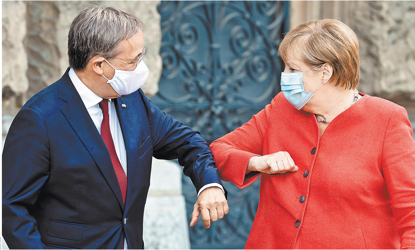
После избрания главой ХДС у Армина Лашета (слева) появился реальный шанс занять кресло Ангелы Меркель по итогам осенних выборов в бундестаг.

Германия бурно обсуждает итоги съезда правящего Христианско-демократического союза. Ведь на нем решался вопрос о том, кто не только станет новым председателем ХДС, но и сможет реально претендовать на кресло канцлера после осенних выборов в бундестаг.