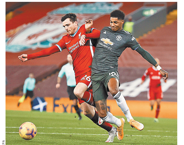
Встреча на «Энфилде» получилась боевой, но без обилия голевых моментов.

Уэйн Руни известен по выступлениям за «МЮ». В стане «красных дьяволов» он провел 13 лет — с 2004 по 2017 год. За этот промежуток англичанин пять раз становился чемпионом страны, победил в Лиге чемпионов и Лиге Европы. Кроме того, Руни — лучший бомбардир в истории сборной Англии. В 120 матчах за «львов» он забил 53 мяча.