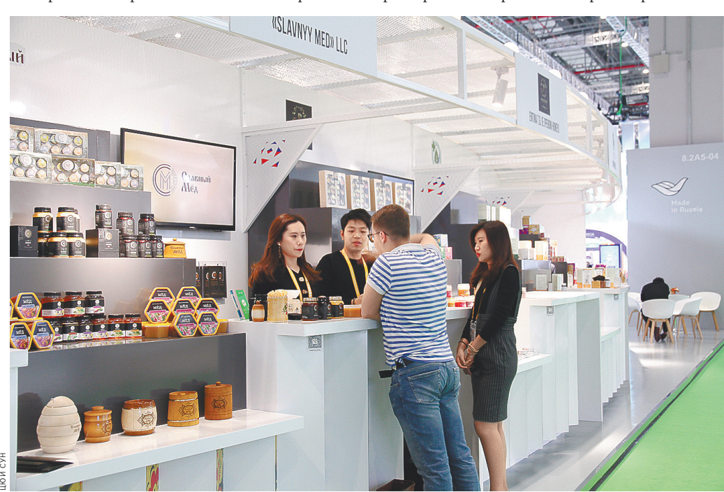
На выставочной площадке сельскохозяйственной продукции был представлен высококачественный мед.

товаров в сфере трансграничной электронной коммерции, внедрение политики, позволяющей перерабатывающим и производственным предприятиям в комплексных зонах свободной торговли проводить давальческие операции (переработка или доработка сырья и готовой продукции).