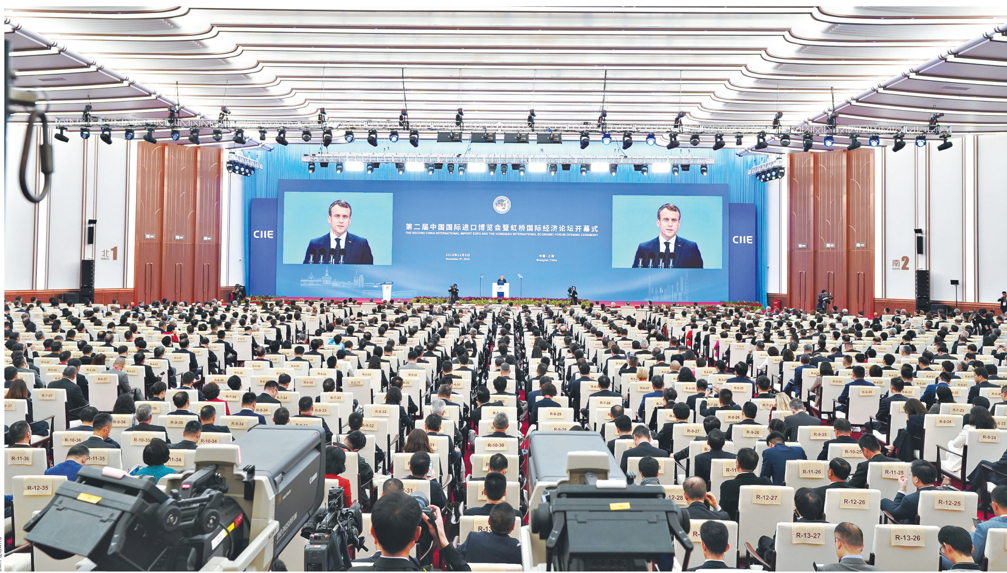
5 ноября в Шанхае состоялась церемония открытия Второй Китайской международной импортной выставки.

Кроме того, вклад в национальную экономику от развития импортной торговли проявляется в уклонении от сравнительно невыгодного положения КНР на мировом рынке. Несмотря на то что Китай — крупнейшая развивающаяся экономика планеты, он все же отстает от ведущих держав по уровню своего экономического развития. Однако даже у развивающихся