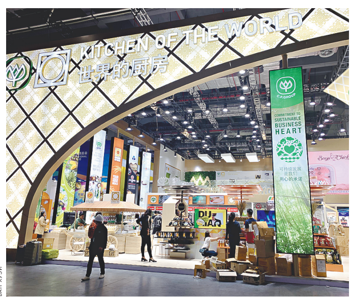
Выставочная площадка продуктов питания и сельскохозяйственной продукции готова к приему посетителей.

Опубликованный недавно Всемирным банком доклад «Ведение бизнеса 2020» продемонстрировал, что Китай улучшил деловую среду ведения бизнеса, поднявшись среди 190 экономик мира с 46-го места в прошлом году на 31-е в этом. КНР стала одной из 10 экономик, показавших наибольшее улучшение в бизнес-сфере после проведенных структурных реформ.