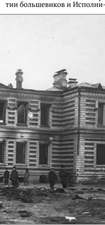
Руины особняка Н.П. Шмита.

Восстановление баррикады на Стральной и на площади Старых Триумфальных ворот. Прибывшие пешие и конные части разогнали людей и снесли баррикады.