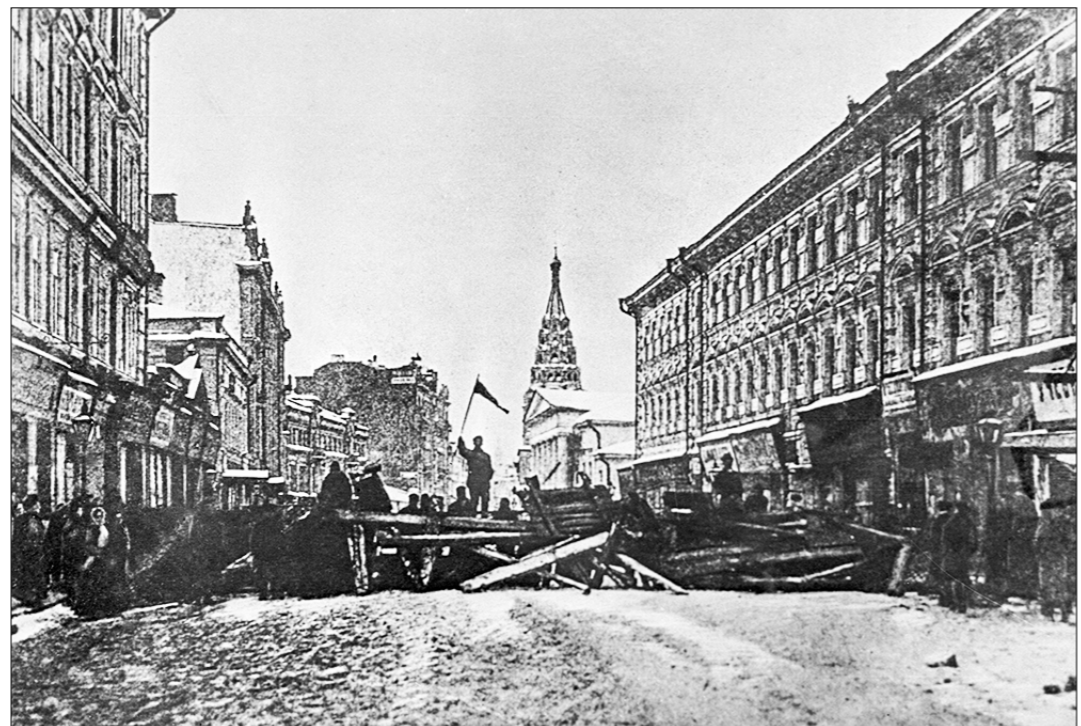
Красное знамя на баррикаде на Арбате.

тор Ф.В. Дубасов, со своей стороны, пообещал обеспечить в городе порядок и спокойствие. Но это уже было не в его силах.