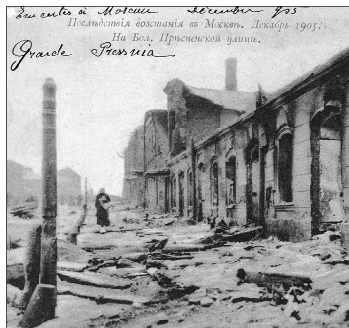
Последствия обстрела на Большой Пресненской улице.

К борьбе с революционерами власти города привлекли обывателей — монархистов и националистов. Был брошен призыв в день св. Николая Угодника, то есть в день тезоименитства царя, собраться на молебен на Красной площади, с тем чтобы выразить свои «верноподданнические чувства». 6 декабря около Лобного места, под звон кремлёвских колоколов, штатными ораторами были произнесены речи с одобрением всех действий правительства, а генерал-губерна-