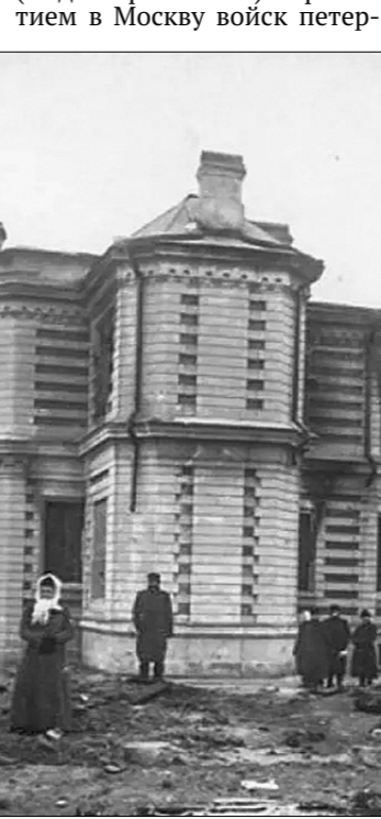
Руины особняка Н.П. Шмита.

Восстановление баррикады на Стральной и на площади Старых Триумфальных ворот. Прибывшие пешие и конные части разогнали людей и снесли баррикады.