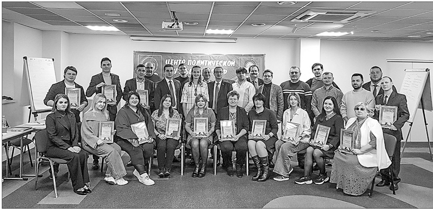
Успешно прошли обучение в городе на Неве участники десятого потока партийно-профсоюзной школы. Представители самых разных регионов нашей страны встретились в партийно-профсоюзной школе при ЦПУ ЦК КПРФ, три года активно работающей в Санкт-Петербурге.