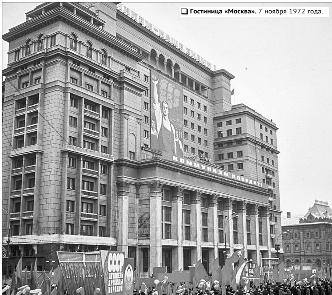
Гостиница «Москва». 7 ноября 1972 года.