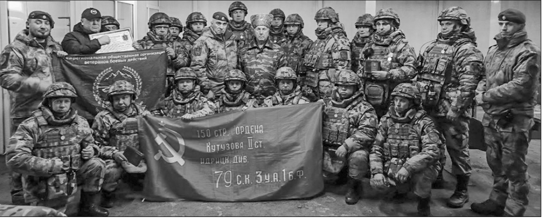
Слова признательности в адрес Компартии звучали и на мероприятиях Росгвардии по ротации войск. Командир соединения Герой России

В настоящее время коммунисты Дона готовят к отправке новогодний «обоз» с вкусными подарками в зону специальной военной операции и детворе Донбасса.